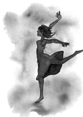
你所看到的惊艳, 都曾被平庸历练。

①宜将剩勇追穷寇,不可沽名学霸王 ②勿以恶小而为之,勿以善小而不为 ③生地茄子熟地瓜,生地菜籽熟地花 ④祸患常积于忽微,智勇多困于所溺