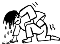
成功不过是站起比倒下多一次

①历尽天华成此景,人间万事出艰辛 ②时人不识凌云木,直待凌云始道高 ③荆棘丛中练内功,勇往直前任征程 ④合抱之木始于毫末,九层之台起于垒土